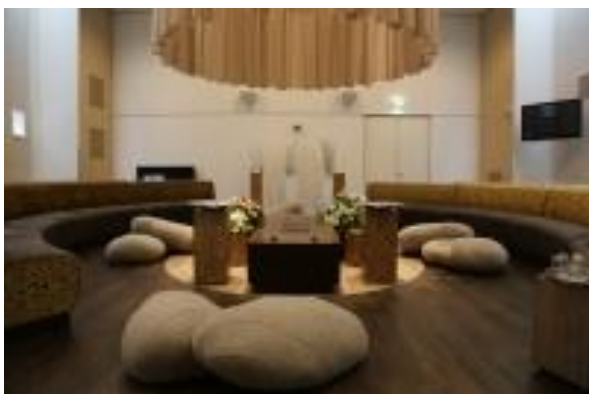
De kleine aula van Daelwijck is intiem, de kist met jullie kind wordt omringd door de gasten

Aan de noordkant van de stad Utrecht, in een mooi aangelegd groen park met een vijver en fontein, ligt Yarden Crematorium Daelwijck. Het gebouw kenmerkt zich door zijn moderne en warme uitstraling. Er zijn 2 aula's beschikbaar, aula 1 heeft 240 zitplaatsen en aula 2 heeft 60 zitplaatsen. Ook dit crematorium is in 2012 geheel gemoderniseerd. Door sommige gasten wordt Daelwijck als erg groot ervaren.