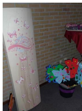
Het kistje van Lysanne is beschilderd, deze tekening is ook gebruikt op haar rouwkaart...

Op de kist met jullie kind kan de favoriete knuffel gelegd worden, of een mooi kleed gekregen van oma bij de geboorte.